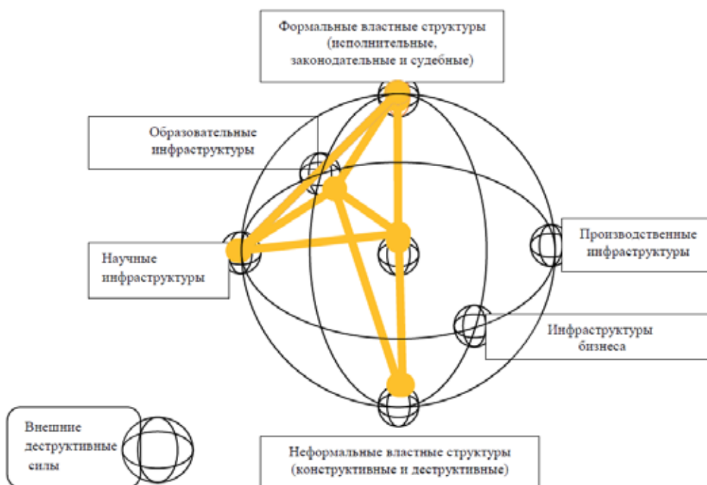
Рис. 1 – Фрагмент фрактальной структуры социума. Инфраструктуры, обеспечивающие жизнедеятельность членов социума. Оранжевым цветом обозначены основные участники заявленной проблемной ситуации и их взаимные связи

На рисунке 1 представлен фрагмент фрактальной структуры социума [8], на котором обозначена визуализация позиционирования основных участников проблемной ситуации и их взаимоотношений.