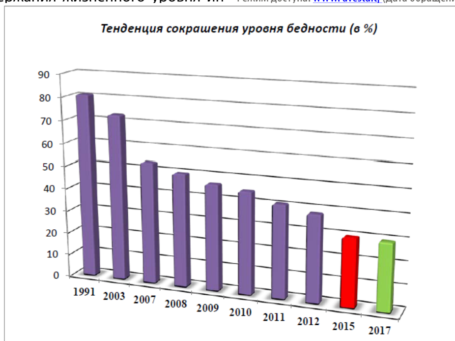
Рис. 1. Тенденция сокращения уровня бедности в %