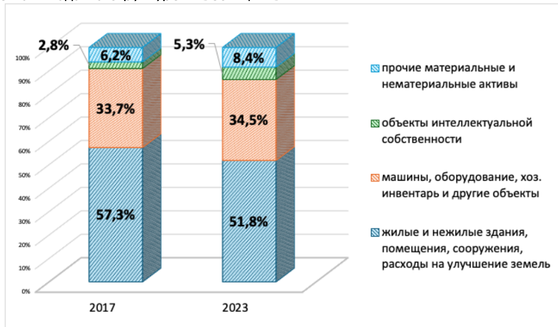
Рис. 1. Структура инвестиций в основной капитал организаций и предприятий реального сектора российской экономики

основной капитал реального сектора Росстат не публикует) структура инвестиций предприятий и организаций, в том числе и в обрабатывающей промышленности, существенно не изменилась.