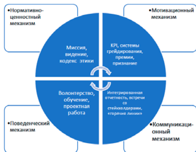
Рис. 1. Схема механизма формирования института корпоративного гражданства инструментами корпоративной культуры.

Нормативно-ценностный механизм направлен на формирование гражданской идентичности. Он отвечает за то, чтобы компания и сотрудники осознали себя частью общества, а не изолированной экономической единицей. Миссия формулируется исходя из общественного блага. Кодекс этики закрепляет нормы взаимодействия не только внутри организации, но и с внешним миром (государством, местными сообществами, экологической средой). «Истории героев» транслируют примеры того, как сотрудники помогли обществу, и это было одобрено компанией. Таким образом, формируется гражданское самосознание, понимание «Мы — компания, которой не все равно», как показывают глубинные интервью с респондентами, относящимися к компаниям с сильной корпоративной культуры.