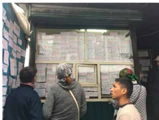
Рис. 3. Снижение уровня жизни населения и востребованность квалификационных кадров – реалии Кыргызстана

Если миграционная ситуация в Киргизии сохранится, то можно будет констатировать, что количество русских в республике за год сократилось на 10–11%. Учитывая, что еще недавно численность русского населения достигала полумиллиона человек, темпы его убыли являются очень значительными. Более высокими они были только в Таджикистане, откуда в первые годы гражданской войны бежало абсолютное большинство некоренного населения.