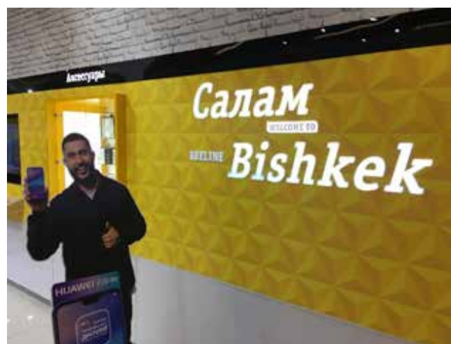
Рис. 2. Добро пожаловать в Бишкек

Как государственный аппарат рефлексировал в создавшейся ситуации? Мы еще раз вернемся к официальной позиции, проанализировав несколько репортажей в СМИ, дающих картину «с мест». Согласно опубликованным в данном Интернет-издания «Белый Парус» в 2009 г. в республике насчитывалось 420 тыс. русских, а к настоящему времени их осталось 370 тыс. Официальной статистики, способной подтвердить или опровергнуть эту информацию, нет. Однако, учитывая массовый наплыв посетителей в посольство России в Бишкеке сразу после «второй киргизской революции» и самозахватов земель, информация «Белого Паруса» выглядит вполне правдоподобной.