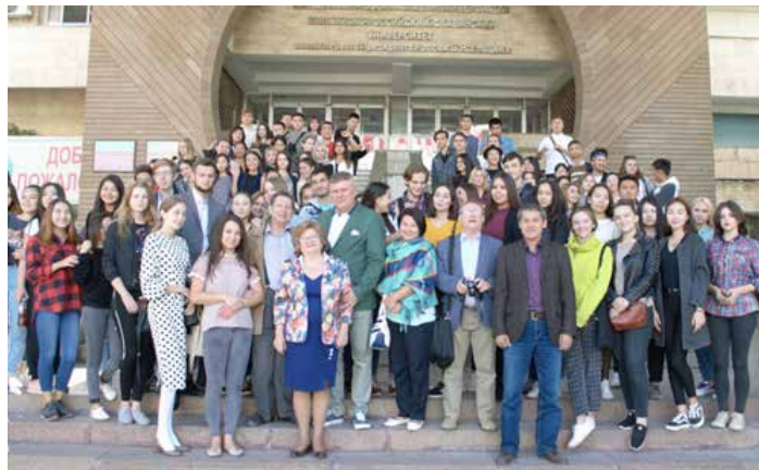
Рис. 4. Студены Кыргызско-Российского славянского университета им. Б. Н. Ельцина

м году проживала самая южная русская община бывшего СССР, насчитывавшая 437 тысяч человек 1 . Сегодня же в Таджикистане осталось не более 50 тыс. русских.