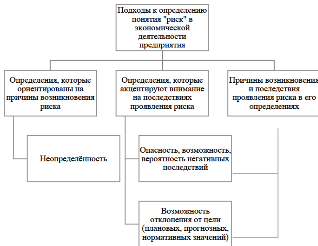
Рис. 1. Подходы к определению понятия «риск» в экономической деятельности предприятия

В литературе существует несколько подходов, которые трактуют понятие риска в экономике предприятия в аспектах риск-менеджмента. На рисунке 1 показаны эти подходы.