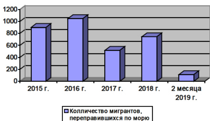
Рис. 1. Динамика миграционных потоков в страны ЕС по морю