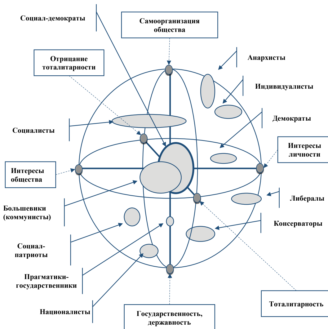
Рис. 1 – Трехмерная качественная сегментация (на сфере) по ценностным ориентирам основных политических партий, групп и их лидеров