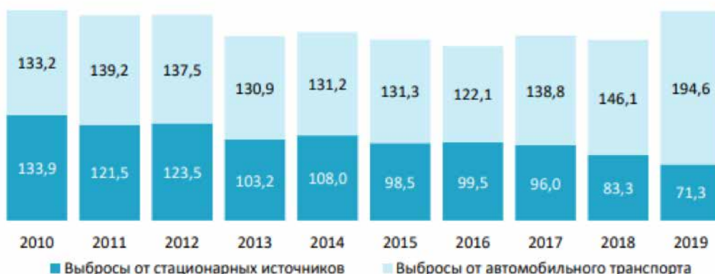
Рис. 1. Динамика выбросов загрязняющих веществ в атмосферный воздух в 2010–2019 гг., тыс. т

Реальная начисленная заработная плата работников организаций (с учетом индекса потребительских цен) практически не растёт и соответствует уровню 2014 года. [Рязанская область в цифрах ]