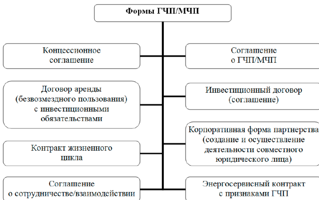
Рис. 2. Формы ГЧП/МЧП