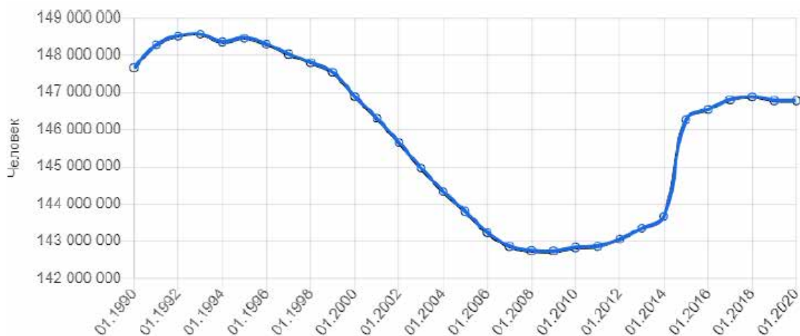
Рис. 3. Численность постоянного населения России на 1 января за последние 30 лет

года кривая опять пошла вниз. Объясняют это, дился тогда. Но, несомненно, здесь присутствует конечно, и волной низкого деторождения в 90-е и влияние антироссийских санкций, снижение годы. Сейчас пришла очередь рожать тех, кто ро- доходов населения.