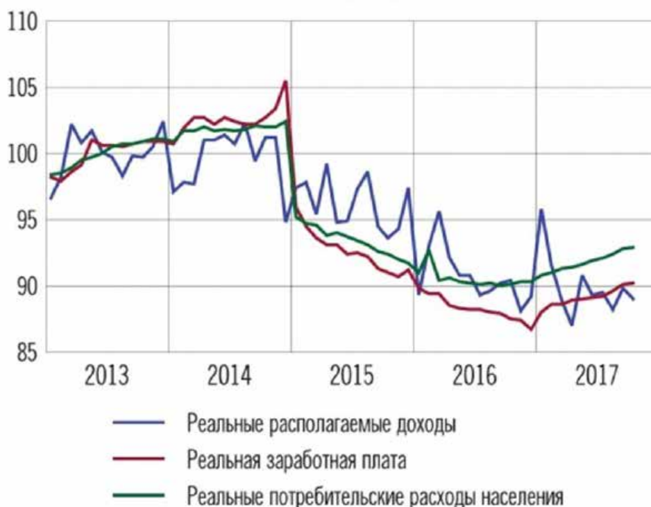
Рис. 2. Реальные доходы населения России. Заработная плата, располагаемые доходы и потребительские расходы населения в реальном выражении (с исключением сезонного фактора, 2013 г. = 100%)

Источник: диаграмма построена авторами по данным Росстата URL: https://www.statbureau.org/ru/russia/inflation-table (дата обращения 15.01.2020).