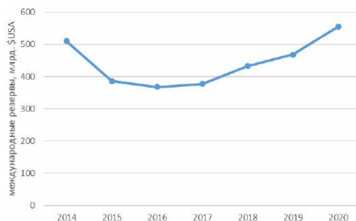
Рис. 4. Международные резервы Российской Федерации 2014–2020 гг. Источник: диаграмма построена авторами по данным Банка России. URL: https://www.cbr.ru/hd_base/mrrf/mrrf_7d/?UniDbQuery.Posted=True&UniDbQuery.FromMonth=7&UniDbQuery.FromYear=2013&UniDbQuery.ToMonth=1&UniDbQuery.ToYear=2020 (дата обращения 15.01.2020).

Этот же вывод подтверждается динамикой международных резервов в Банке России, см. график на рисунке 4. Как видим, с начала санкций резервы стали таять, но затем, начиная с 2016 года вновь стали расти и превысили уровень января 2014 года.