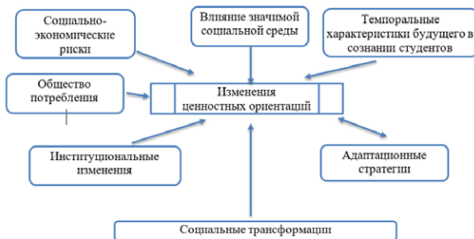
Рис. 1. Модель трансформации ценностных ориентаций студенческой молодежи

Трансформацию жизненных стратегий студенческой молодежи логично описать используя такой термин как вектор. Вектор динамики ценностных ориентаций можно определить как сложившуюся тенденцию, определенную направленность изменений ценностных ориентаций за определенный промежуток времени.