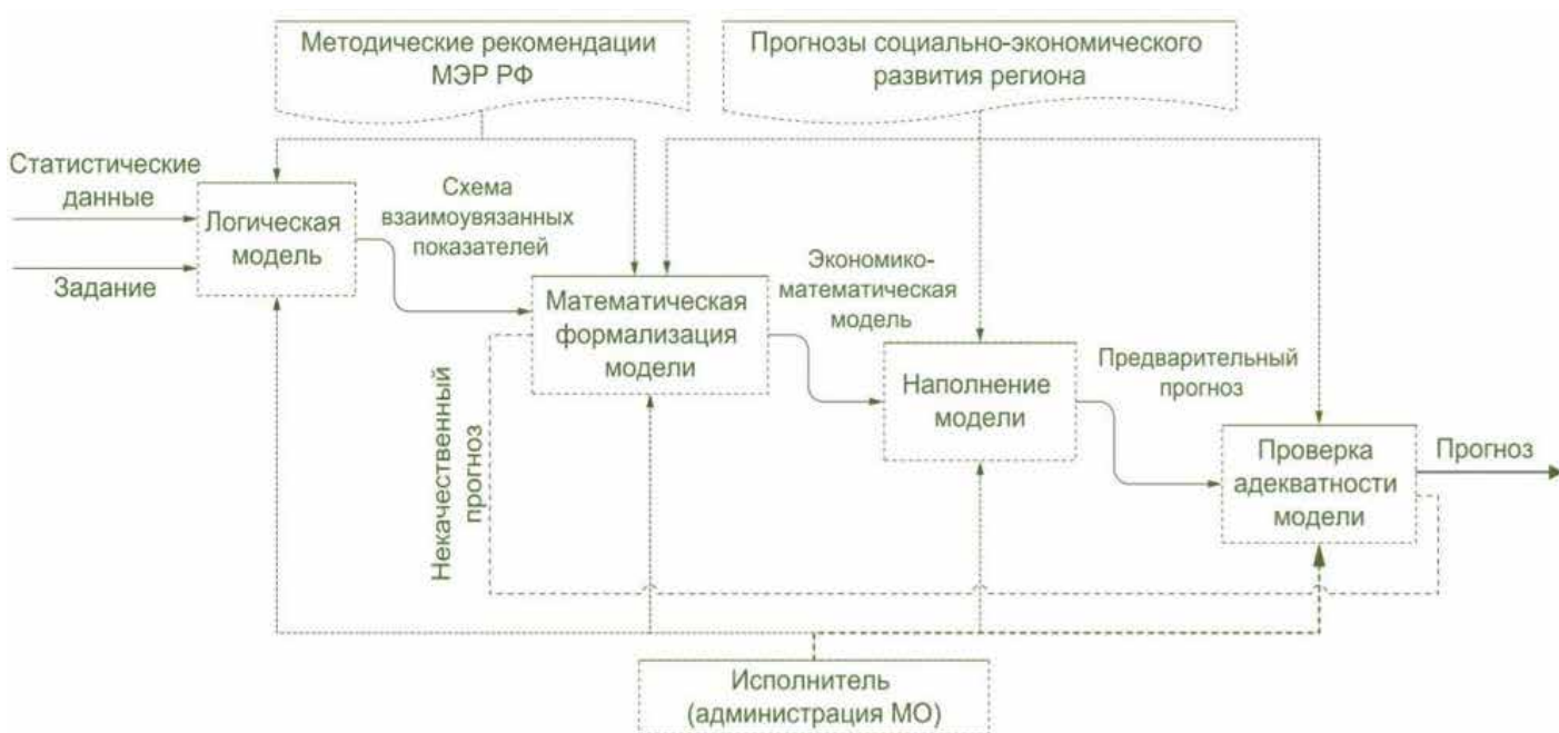
Рис. 1. Процесс разработки экономико-математической модели социально-экономического развития муниципального образования

На рисунке 1 в укрупненном виде наглядно представлен процесс разработки экономико-математической модели на основе применения методологии IDEF0.