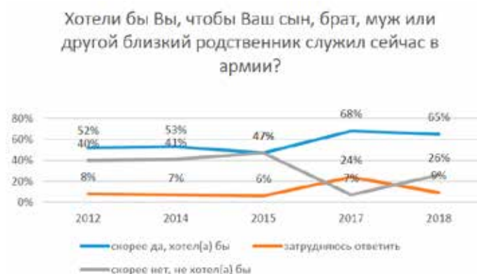
Рис. 2. Оценки населения РФ, общероссийский опрос ВЦИОМ, в % от числа опрошенных

однако не имеет и явной негативной тенденции.