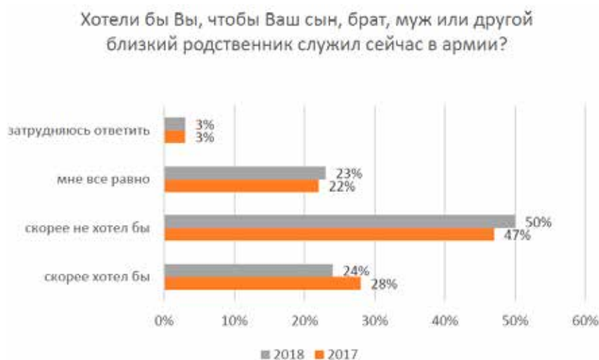
Рис. 3. Оценки допризывной молодежи, в % от числа опрошенных

Таким образом, полученные нами в ходе авторского исследования оценки престижности военной службы среди студенческой молодежи являются валидными, так как уже в допризывном возрасте существует тенденция на снижение оценок престижности службы в армии.