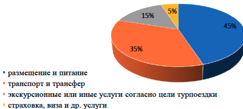
Рис. 3. «Модальная» структура стоимости туристской путевки, %

Рассмотрим модальную структуру стоимости туристской путевки, отражающую типовые затраты туриста в туристской поездке. Данные представлены на Рисунке 3.