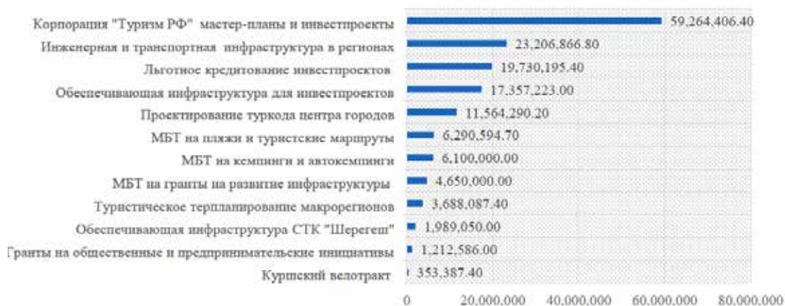
Рис. 2. Мероприятия ФП «Туристская инфраструктура» и объем финансирования, тыс. рублей